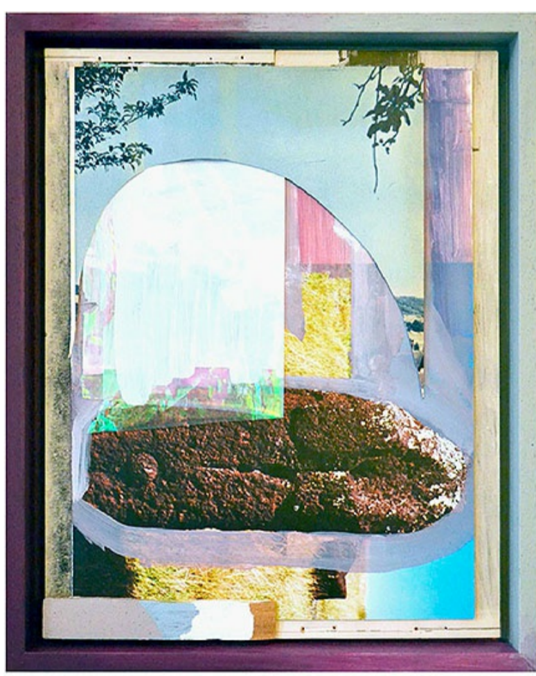
Palais de Versailles # 5, 2022