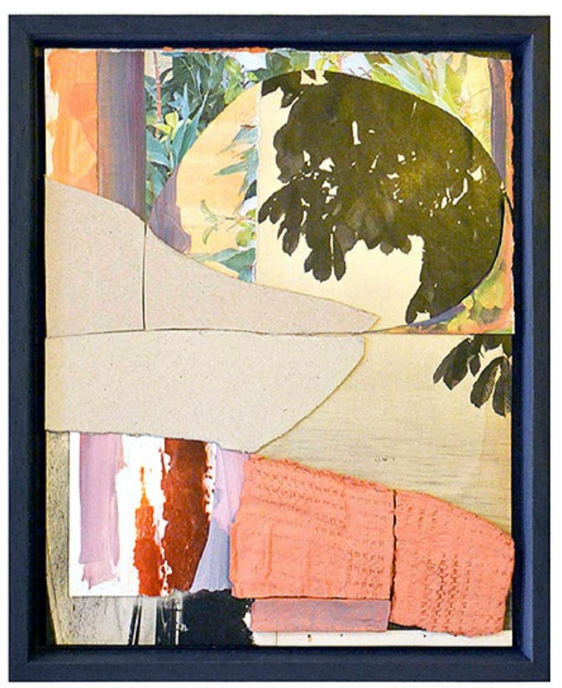
Palais de Versailles # 10, 2022

Oude fotoboeken en tijdschriften met beeldmateriaal van verre oorden, verdwenen steden en oude beschavingen dienen als uitgangspunt voor de collages van Stijn Mulder . Zo verwijst de serie Dubrovnic Raguse naar de oorsprong van Dubrovnic, de stadstaat Ragusa, die in de 16e eeuw kon wedijveren met het oppermachtige Venetië. En in de serie Revised Paradise zet Mulder de schepping naar zijn hand. Of neem de serie Holy Land , waarin gedroogde stukken klei het landschap en de bouwwerken letterlijk lijken te overweldigen.